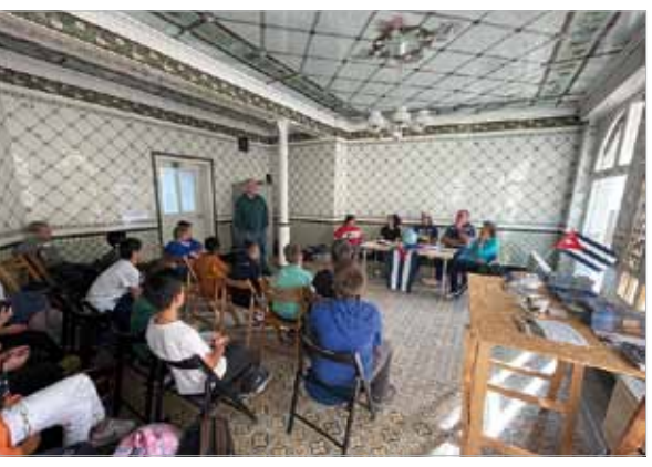
Kindergeschichten von José Martí im Fliesenschön-Saal der Ökumenischen Akademie Gera/Altenburg.

Wenn keine aktuellen Kontaktangaben aufgeführt sind, erfragen Sie diese bitte telefonisch bei Cuba sí (030) 24009455.