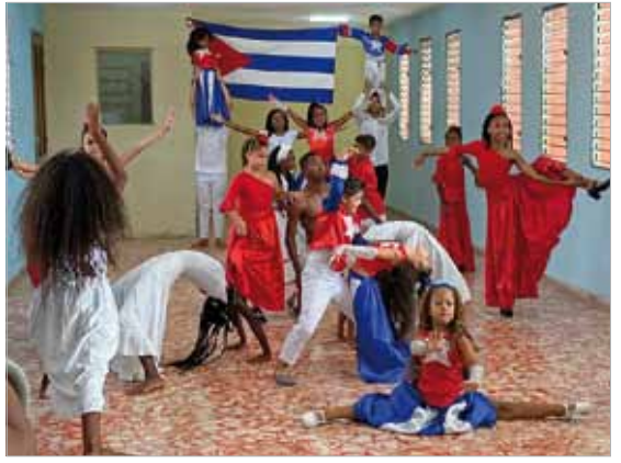
Tanz und Akrobatik erwartete die Delegation im soziokulturellen Projekt in El Cano. In diesem Stadtviertel Havannas unterstützt Cuba sí die soziale Infrastruktur.