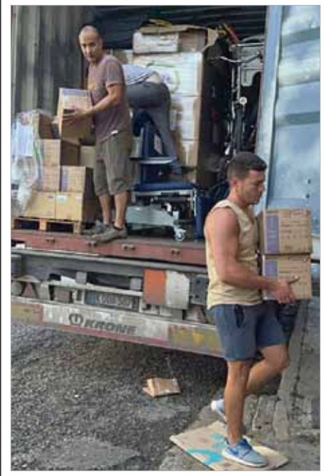
Beim Ausladen und Sortieren der Fracht für die verschiedenen Empfänger in Kuba.

Der am 26. August 2023 in Berlin beladene Solidaritätscontainer kam Mitte November 2023 im Hafen Mariel an. Ein gutes Dutzend Cuba sí-Aktivisten hatte ihn bis unters Dach vollgepackt mit