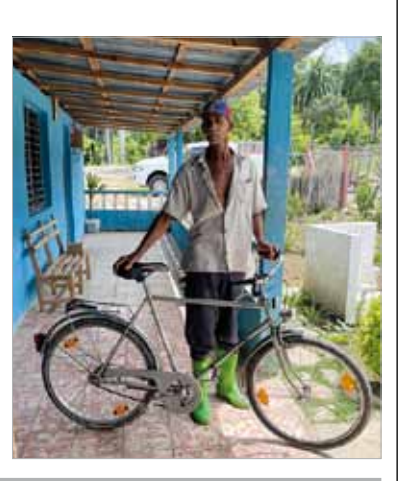
Die gelieferten Fahrräder verbessern die Mobilität in den ländlichen Gebieten erheblich, u.a. für die Mitarbeiter im Betrieb "Frank País".

September 2023: Die Verarbeitung von Obst und Kräutern zu Trockenfrüchten und Gewürzen mit dem von Cuba sí gespendeten Solartrockner im Betrieb "Ángel Bouza" bereichern nun ein weiteres Folienschweißgerät, Folien, Küchenwaagen, Gummihandschuhe und Messersets.