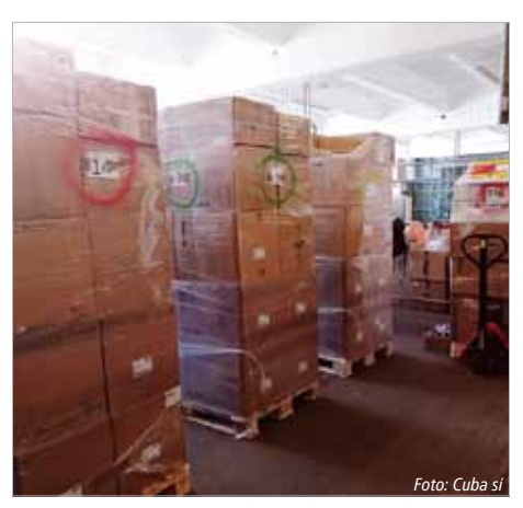
26. August 2023, Berlin, Cuba sí-Sachspendenlager: Bei der Beladung des Containers.

Die Packliste für die zwei 40-Fuß-Container wies 6 000 Paar OP-Handschuhe, 40 000 unsterile Handschuhe, je 240 000 Einweg-Spritzen und -Kanülen, 12 000 Venenverweilkanülen, 52 000 sog. Butterfly-Kanülen, 10 800 FFP2-Masken, 3 600 Harnblasenkatheter, 450 zentrale Venenkatheter, 17 Geräte zur Beatmungsluft-Anfeuchtung samt Zubehör auf. Im Lager bereits versandfertig warteten 24 Nachttische, vollgestopft mit Inkontinenzmaterial, 5 Krankenhausbetten, ein Kinderbett, drei Untersuchungsliegen, drei elektrisch verstellbare Lagerungsstühle, 50 Computersysteme.