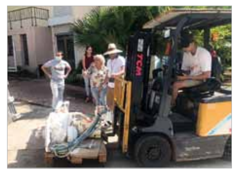
Im Nationalen Institut für Neurowissenschaften wird die wertvolle Röntgentechnik neurodentale Forschungsarbeit unterstützen.