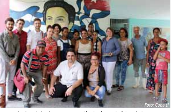
Besuch des Schulzentrums "Clorinda Ruiz" in El Cano.