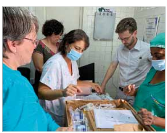
Materielle Solidarität: Die Delegation bei der Übergabe medizinischer Sachspenden an die Neugeborenenstation im Krankenhaus für Risikoschwangerschaften "Ramón González Coro" in Havanna.