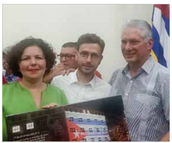
Am Rande der Feierlichkeiten zum Jahrestag des Sturms auf die Moncada-Kaserne fand eine internationale Solidaritätsveranstaltung in der Universidad de Oriente in Santiago de Cuba statt. Bei dieser Gelegenheit übergab Tobias Bank (Mitte) dem kubanischen Präsidenten Miguel Díaz-Canel (r.) im Namen der Partei Die Linke ein Foto, welches das in den kubanischen Farben angestrahlte Karl-Liebknecht-Haus in Berlin zeigt.