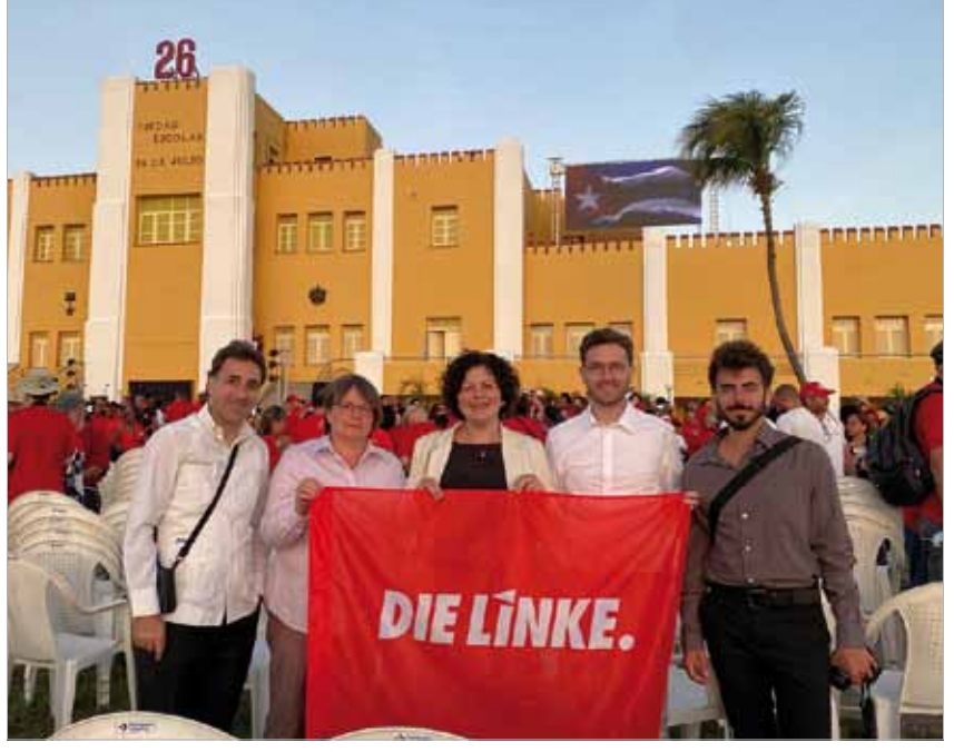
26. Juli 2023, Santiago de Cuba: Einst Kaserne, heute Schule - vor der Moncada erlebte die Delegation zusammen mit hochrangigen Gästen aus Politik, Gewerkschaften und Solidaritätsbewegung die Feierlichkeiten.