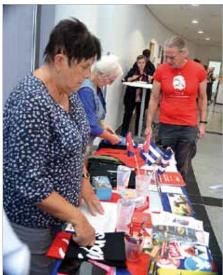
Cuba sí-Infostand auf dem Thüringer Landesparteitag der Linken am 24. September 2023

Das Jahr 2023 war das bisher erfolgreichste während des 15-jährigen Bestehens unserer Regionalgruppe Wartburgregion. Im Frühjahr und im Herbst 2023 trafen wir uns zur Planung und Auswertung unserer Aktivitäten, die zahlreich waren: So gestalteten wir einen Infostand mit Kuchen- und Solibasar am 1. Mai