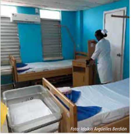
Blick in die neue Station: Betten und Matratzen für die Neugeborenen und ihre Mütter, Schränke und weitere Ausrüstung aus einer Cuba sí-Spende komplettieren das Betreuungsangebot "piel a piel" und sorgen für eine entspannte Mutter-Kind-Bindung.

Idolkis Argüelles Berdión, Guantánamo Übersetzung: Miriam Näther