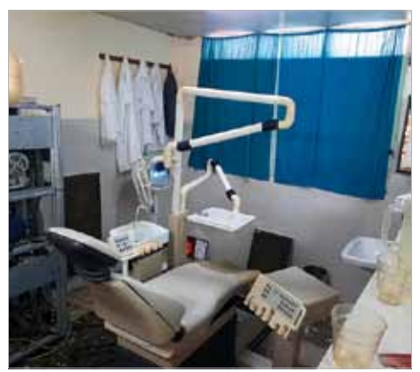
Eine von zwei gespendeten Behandlungseinheiten in Felicidad.

Damit beginnt die Arbeit der Arbeitsgruppe Gesundheitswesen bei Cuba sí. Als Zahnarzt bin ich für die Zahnarztpraxen verantwortlich, als Landwirt halte ich nebenher meine Augen nach Sachspenden für die kubanische Veterinärmedizin offen. Ich kontaktiere umgehend die Praxen, besuche sie (wenn irgend mög-