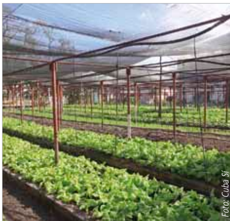
Ein Organopónico (Stadtgarten) – urbane Gemüseerzeugung in Guantánamo.

Neben dem Ausbau der urbanen Landwirtschaft („Organopónicos“) genießen seit 2012 Genossenschaften (UBPC) größere Autonomie.