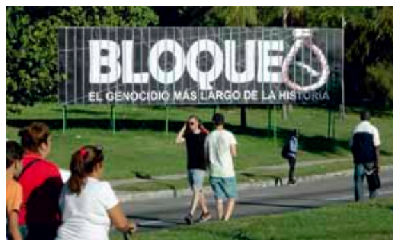
Transparent in Havanna:

Ebenso wird verschwiegen, dass der nun gefasste Beschluss das Ergebnis eines Verhandlungsprozesses zwischen verschiedenen politischen Strömungen im Parteivorstand darstellt, da der ursprünglich von Emali eingebrachte Antrag mit dem Titel „Solidarität mit Kubas demokratischen Menschenrechtsaktivist*innen“ noch vor der Beratung zurückgezogen und durch den letztlich beschlossenen Antrag ersetzt wurde. Bei näherer Betrachtung des ursprünglichen Antrages der Emanzipatorischen Linken