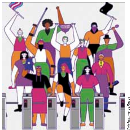
Die „Coordinadora Feminista 8M“ ist eine treibende Kraft des Aufstands in Chile

Das alles ertrugen die Chilenen jahrelang. Ein Funke genügte aber, ein loderndes Feuer zu entfachen. Am 18. Oktober 2019 sprangen hunderte Schüler über die Einlassdrehkreuze der U-Bahn, um gegen eine Preiserhöhung zu protestieren. Die Regierung unter Präsident Piñera nahm die Preiserhöhung zwar nach der gewaltsamen Unterdrückung der Proteste zurück, aber diese waren nicht mehr aufzuhalten. Die stille Unzufriedenheit mit seiner Politik – hohe Lebenshaltungskosten, niedrige Renten, hohe Preise für Medikamente, das privatisierte Bildungssystem mit der Verschuldung durch Studienkredite und sozialer Ungleichheit als Folge des neoliberalen Wirtschaftssystems – entlud sich explosionsartig. „Chile ist erwacht“ war nun die Losung.