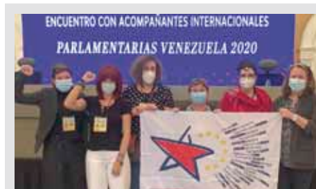
Die Partei Europäische Linke gratuliert dem venezolanischen Volk zum Wahlsieg am 6. Dez. 2020.