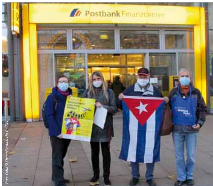
Im Rahmen der Protestaktion „UnblockCuba“ wurde der Postbankfiliale Chemnitz am 25. November 2020 ein Protestschreiben wegen der Verweigerung von internationalen und innereuropäischen Zahlungsaufträgen mit Bezug auf die Republik Kuba von Chemnitzer Cuba Sí-Aktivist*innen übergeben!