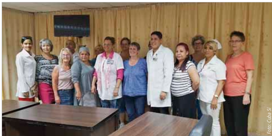
Im Krankenhaus „Agostinho Neto“ in Guantánamo wurden wir durch die Direktion um Unterstützung gebeten.