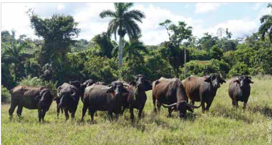
Büffelherde in der von Cuba Sí unterstützten Produktionseinheit „UBPC 10. Oktober“ des Projektteils Yateras in Campo Verde, Provinz Guantánamo.