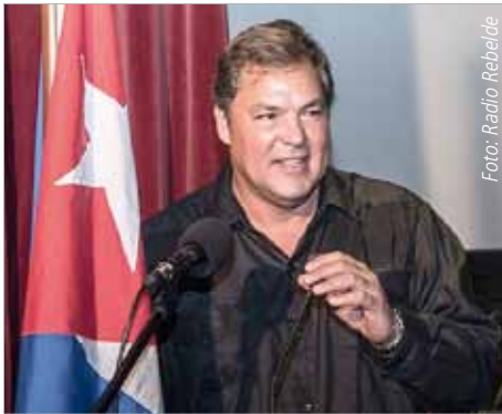
Ramón Labañino Salazar

Der studierte Ökonom Ramón Labañino Salazar ist nicht nur einer der Fünf Helden ( Los Cinco ) der Republik Kuba, der Informationen über geplante feindselige Aktivitäten exilkubanischer Gruppen sammelte. Er ist auch Vizepräsident der Nationalen Vereinigung der Ökonomen Kubas (ANEC). In dieser Funktion sprachen wir mit ihm über die Umsetzung grundlegender Strukturveränderungen in der kubanischen Politik und Verwaltung, z. B. der Währungsreform, die sogenannte Tarea Ordenamiento .