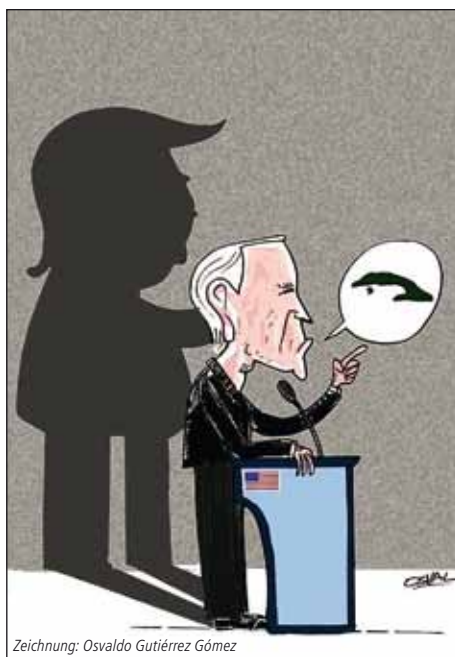
Zeichnung: Osvaldo Gutiérrez Gómez

gesellschaftlichen Kräfte in den USA, die die Blockadepolitik gegen Kuba für gescheitert ansehen. Dazu gehören Solidaritätsorganisationen und linke Bewegungen wie z.B. die Latin America Working Group (LAWG) , Center for Democracy in America (CDA) , Pastors for Peace , aber auch Unternehmensverbände, die sich von einer Annäherungspolitik neue Märkte und Profite versprechen. Inzwischen birgt dies politische Implikationen, weil neben westlichen Unternehmen zunehmend chinesische und russische Konkurrenten auftreten. Im US-Kongress gibt es wieder Versuche, entsprechende Gesetze einzubringen.