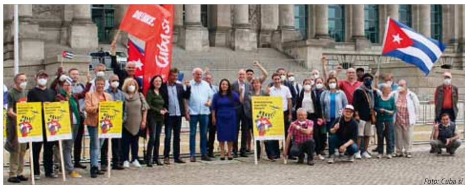
24. 6. 2021, Reichstag: Abgeordnete der Linksfraktion unterstützten die Cuba sí-Kundgebung