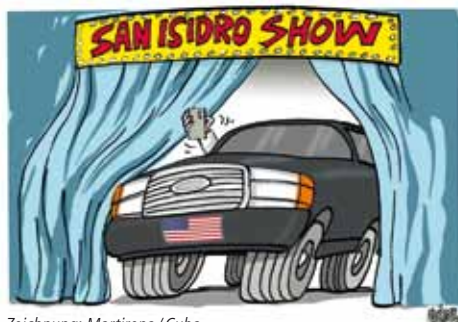
Zeichnung: Martirena / Cuba

Die Bewegung San Isidro entstand im Dezember 2018 angeblich als Protest gegen das Dekret 249. Hierbei handelt es sich um einen Gesetzesvorschlag zum Schutz von Kunst und Kultur. Ähnliche Bestimmungen gibt es auch in Deutschland. In der internationalen öffentlichen Meinung wurde er jedoch vor allem als Versuch des kubanischen Staates ausgelegt, seine Künstler und Intellektuellen zu kontrollieren.