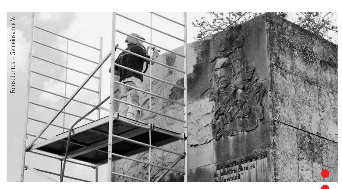
Mit Skalpellen und Bürsten, mit Spezialmörtel und einem besonderen Pulverstrahlverfahren werden Verschmutzungen und biologische Auflagerungen entfernt, ohne die Oberflächenstrukturen zu zerstören.

Weitere Infos: Juntos – Gemeinsam e.V., www.juntos-gemeinsam.com