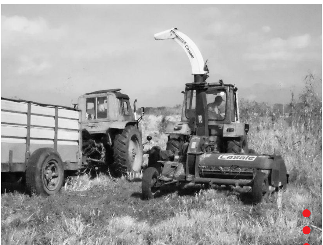
Die kombinierte Ernte- und Häckselmaschine im Einsatz auf den Flächen des Zuchtbetriebes "Valle del Perú" in der Provinz Mayabeque, in dem das Cuba Sí-Milchprojekt angesiedelt ist.

Bereits 2011 hatte Cuba Sí mit einer Sonderspendenaktion einen Bulldozer für den Projektbetrieb gekauft, mit dem seither mehrere Hundert Hektar mit Dornensträuchern zugewucherte Flächen freigeräumt wurden. Auf diesen Flächen werden nun Futterpflanzen angebaut, um die kontinuierliche Versorgung der Rinder sicherzustellen. Um die größere Futtermenge zu ernten und zu verarbeiten, hat Cuba Sí 2015 noch einmal zu einer Spendenaktion für eine kombinierte Ernte- und Häckselmaschine aufgerufen. Diese Maschine verarbeitet pro Stunde bis zu 25 Tonnen Futter und stellt die Versorgung für mehr als 600 Milchkühe sicher. "Die Maschine ist hervorragend für die kubanischen Bedingungen geeignet", sagt Onel. "Sie ist sicher zu bedienen, hat niedrige Wartungskosten und ist haltbar und langlebig. Dank Cuba Sí verfügen wir über ein exzellentes Arbeitsgerät!" Robier Hernández