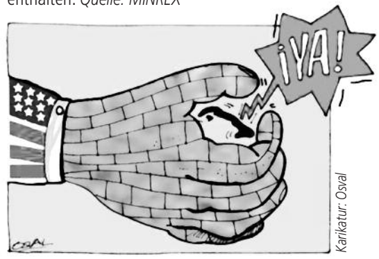
"Ya!" – Schluss damit, es reicht!"

Die US-Blockade wird jedes Jahr in der UN-Vollversammlung von den Mitgliedsstaaten fast einstimmig abgelehnt. 2016 stimmten 191 Länder gegen die Blockade, die USA und Israel hatten erstmals nicht für die Blockade votiert, sondern sich der Stimme enthalten. Quelle: MINREX