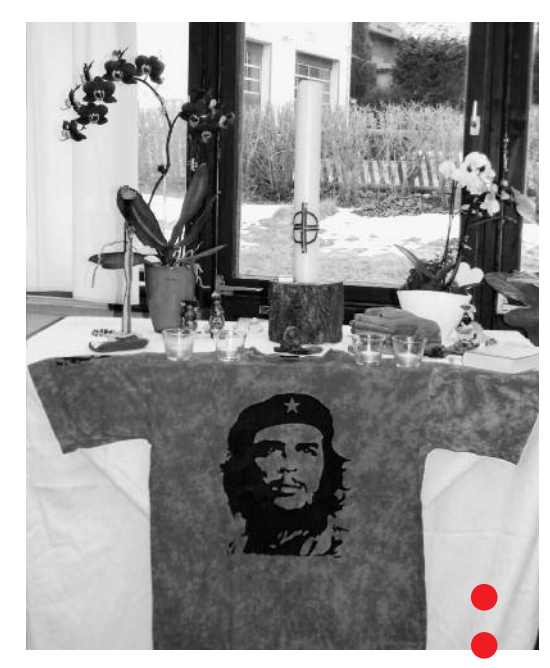
Altar, geschmückt mit einem Che-T-Shirt, bei der Veranstaltung zum Weltgebetstag in Finsterbergen