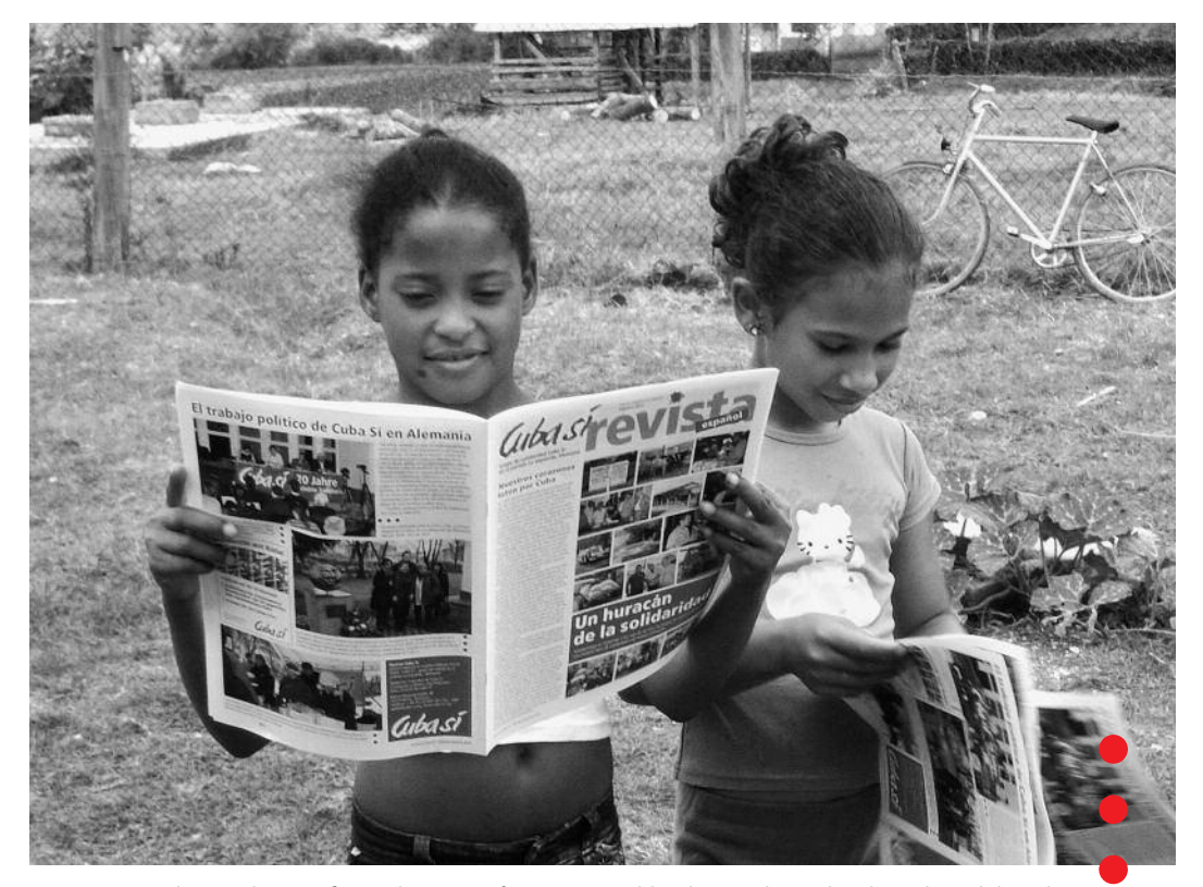
Es erstaunt nicht nur die "Großen", dass es im fernen Deutschland Menschen gibt, die Kuba solidarisch unterstützen. Kinder im Projekt Guantánamo lesen die neue Ausgabe in Spanisch, März 2013.

"La Revista" (die Zeitschrift) ist im Spanischen wie im Deutschen weiblich – und so feiert die Redaktion im Sommer 2013 auch eine kleine Fiesta de quinceañera. Jörg Rückmann