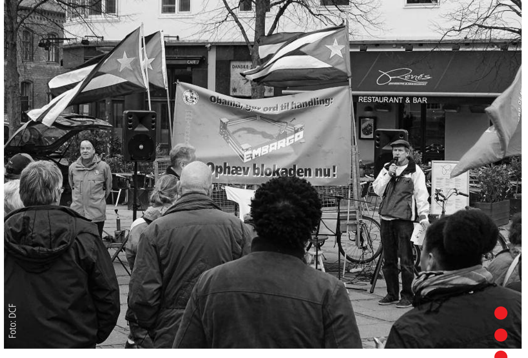
Mitstreiter der "Dansk-Cubansk Forening" während einer Straßenaktion gegen die US-Blockade in Kopenhagen

"Dansk-Cubansk Forening" finanziert ihre Solidaritätsarbeit durch private Spenden, für einzelne Projekte startet sie aber auch Fundraising-Aktionen. Eine staatliche Unterstützung für Solidaritätsprojekte mit Kuba gibt es in Dänemark nicht. • Infos: www.cubavenner.dk