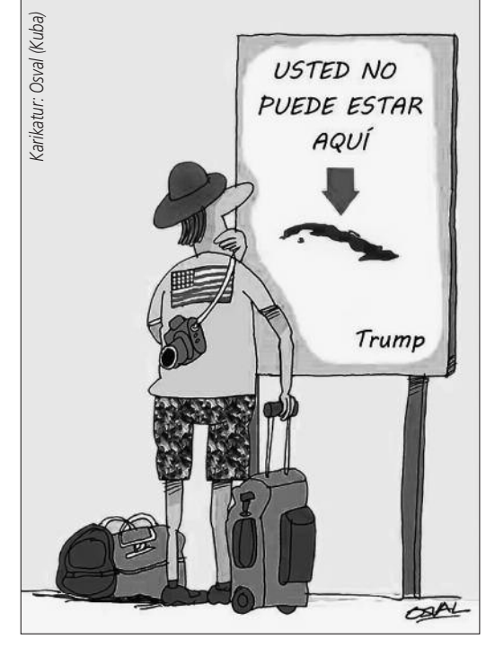
• "Hier dürfen Sie nicht sein. Trump"

Das derzeit in Havanna getestete Modell verfügt unter anderem über Kameras für das Rückwärtsfahren und Näherungssensoren, um Unfälle zu vermeiden. Ein Sensorsystem in den Türen verhindert das Schließen, wenn sie durch Gegenstände oder Fahrgäste blockiert werden. Quelle: ACN