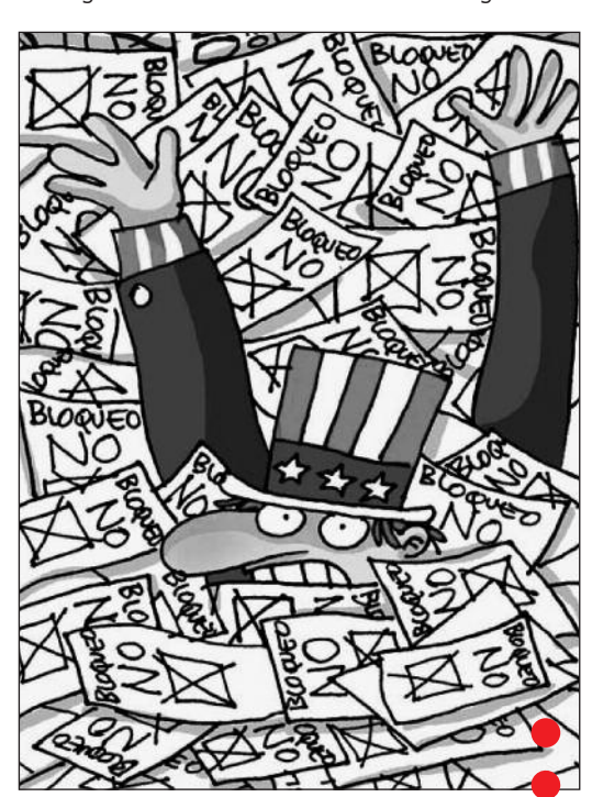
Ein überwältigendes "NO!" in der UNO-Abstimmung 2013 zur US-Blockade: 188 Staaten gegen die USA und Israel. (Karikatur: Martirena, Kuba)

• Im November 2013 zahlte die Schweizer Firma Weatherford International Ltd. 252 Mio. US-Dollar Strafe an die USA wegen Verstößen gegen die Blockadegesetze. Weatherford stellt Ausrüstungen für