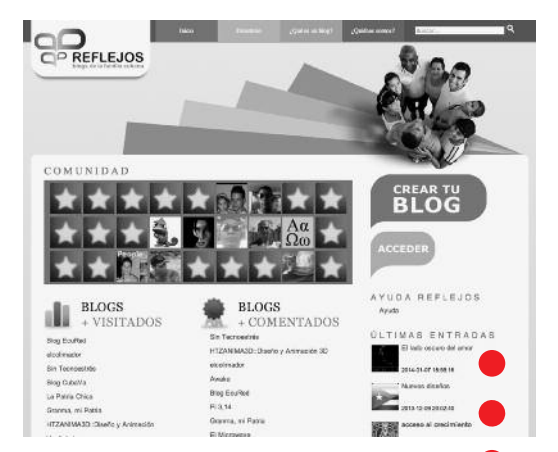
Die Startseite von "Reflejos"

Soziale Netzwerke erfreuen sich überall auf der Welt großer Beliebtheit. So auch in Kuba. Nur sind Facebook und Twitter US-Unternehmen, und Kuba konstatiert immer wieder Unregelmäßigkeiten und Probleme bei der Benutzung dieser Netze. So konnten Kubaner eine Zeit lang Facebook nicht nutzen, und manchmal verschwinden gepostete Beiträge aus unerfindlichen Gründen.