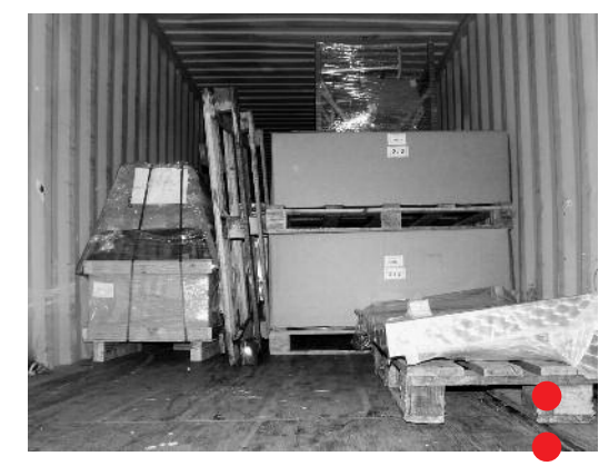
29. November 2012, Isseroda, Thüringen: Die Kisten mit den Maschinen für die Fleischerei werden in den Container verladen.

Wir werden alles dafür tun, das Fleischereiprojekt zu einer Erfolgsgeschichte zu machen. Und dann wird in Mayabeque die Thüringer Wurst – im wahrsten Sinne des Wortes – in aller Munde sein.