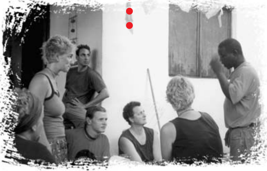
Foto oben: Steine schleppen für das Gemüsebeet Foto unten: Arbeitsberatung im Workcamp

wie dem Auspulen von Maiskolben und dem Säubern von schwarzen Bohnen und Reis zuwandten. Das waren recht gemütliche Stunden und regte uns zu lebhaften Schwätzchen mit den Kubanern an.