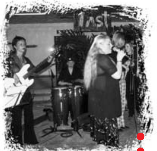
Der Beratungstag endete mit einem Konzert der Berliner Frauen-Salsa-Band „Clarissa y las diablitas“. Die Teufelinnen, die zuvor erfolgreich beim Jazz-Festival in Havanna aufgetreten waren, haben jetzt auch hier viele Fans.

● Obwohl die Milchwirtschaft weiterhin Hauptproduktionszweig der Betriebe bleibt, wird durch die Projektarbeit eine Diversifizierung gefördert und die Produktpalette durch Fleischproduktion (je nach örtlichen Möglichkeiten Mastbullen, Schweine, Kaninchen, Schafe, Ziegen, Geflügel oder Bienen) sowie den Anbau von Gemüse, Obst, Wurzel- und Knollenfrüchten, teilweise auch durch eigene Saatgutherstellung und Baumschulen, erweitert.