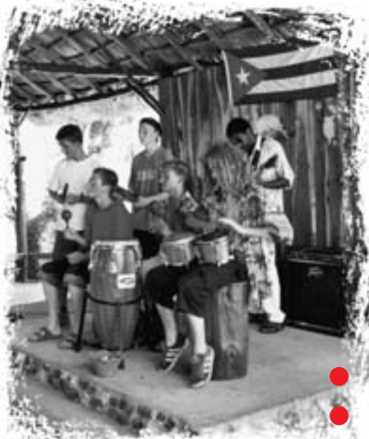
Mit kubanischer Musik taut man selbst den kältesten Deutschen auf ...

„Kuba und Deutschland sind nicht nur unterschiedlich in Temperaturen, Landschaften und Politik, sondern auch durch die Menschen: Hier bei uns in Deutschland sind viele kaltherzig und verschlossen, aber dort in Kuba haben wir viele warmherzige Menschen getroffen. Wir haben so viel erlebt, dass ich gar nicht weiß, was am schönsten war oder was mich am meisten beeindruckt hat. Ich konnte es gar nicht fassen, wie schnell ich dort neue Freunde gefunden habe. Alles, was wir gesehen haben, schien für die Kubaner selbstverständlich zu sein – für mich gilt das nicht: Das Delphinarium, der Pionierpalast, das Revolutionsmuseum und die Festung in Havanna, Straßenmärkte, Schulzentrum für Behinderte ... Einige von uns hatten sogar eine Privatführung am 25. Juli durch die Straßen von Cárdenas: Was gibt es Schöneres, als sich kostenlos durch sämtliche Spezialitäten Kubas zu futtern und mitzufeiern! Ja sicher, schön ist es auch, wenn man wieder im kalten Deutschland hockt und warme Grüße aus Kuba bekommt. Ich danke allen von Cuba Sí und den Kubanern, die diese Reise für uns möglich gemacht haben. Ihr seid Spitze!“